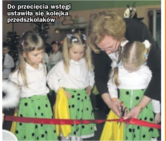
Do przecięcia wstęgi ustawiła się kolejka przedszkolaków