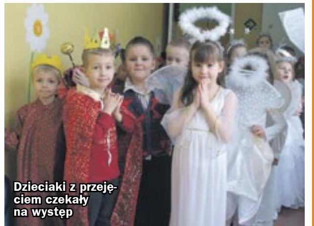
Dzieciaki z przejęciem czekały na występ