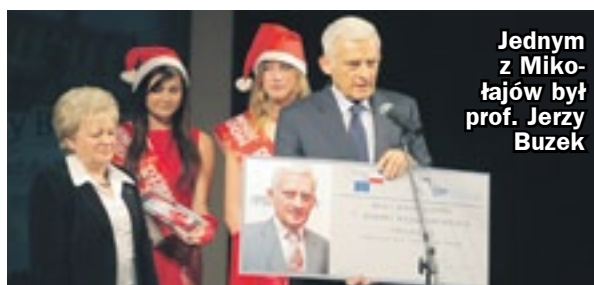
Jednym z Mikołajów był prof. Jerzy Buzek

Informator „Ferie 2012” dostępny jest m.in. w zabrzańskich szkołach oraz instytucjach kultury i obiektach sportowych. W wersji elektronicznej można go również znaleźć na stronie internetowej Urzędu Miejskiego www.um.zabrze.pl . (hm)