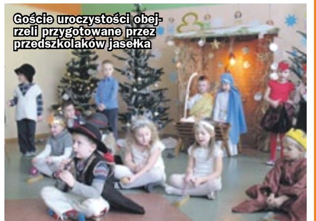
Goście uroczystości obejrzeli przygotowane przez przedszkolaków jasełka