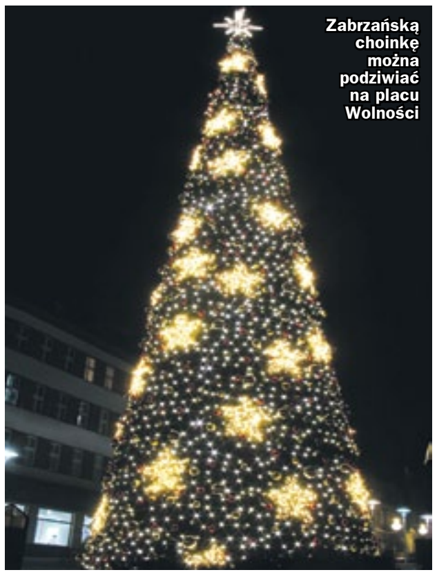
Świąteczna iluminacja robi imponujące wrażenie

Zabrzańską choinkę można podziwiać na placu Wolności