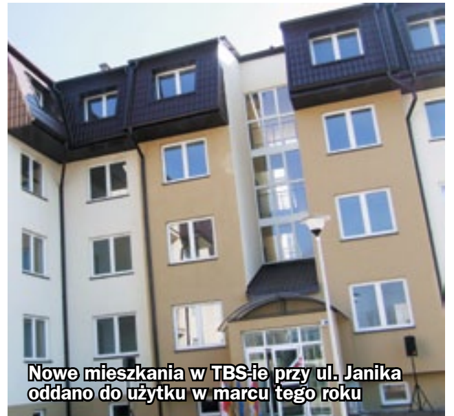
Nowe mieszkania w TBS-ie przy ul. Janika oddano do użytku w marcu tego roku