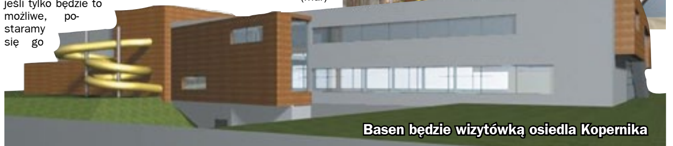
Basen będzie wizytówką osiedla Kopernika