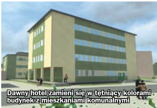
Dawny hotel zamieni się w tętniący kolorami budynek z mieszkaniami komunalnymi

od strony wschodniej. W przebudowanym już hotelu znajdują się również pomieszczenia zaadaptowane dla warsztatów terapii zajęciowej. Średni metraż mieszkań, jakie zostaną oddane tam do użytku wyniesie 45 metrów kwadratowych. - Połowa mieszkań będzie