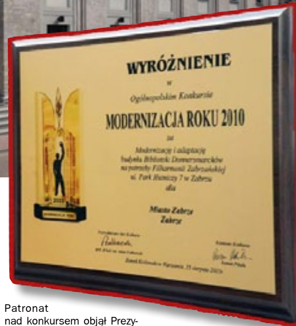
Patronat nad konkursem objął Prezydent Rzeczypospolitej Polskiej, Bronisław Komorowski. (m)

Do tegorocznej edycji elitarnego plebiscytu „Modernizacja Roku” nadesłano rekordową ilość, 703 zgłoszeń, ale tylko nieliczni mogli cieszyć się z certyfikatu finalisty. Organizatorem konkursu są Targi Pomorskie Sp. z o. o. oraz Stowarzyszenie Ochrony Narodowego Dziedzictwa Materialnego.