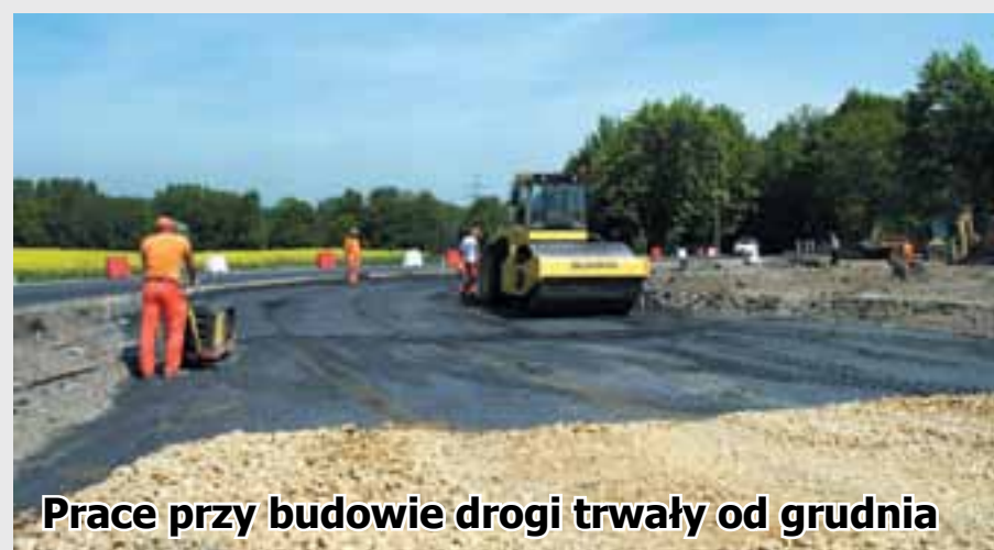
Prace przy budowie drogi trwały od grudnia

Odbiory techniczne już trwają, a za niecałe dwa tygodnie będziemy mogli już nią dojeżdżać do zabrzańskich części strefy ekonomicznej zlokalizowanych w tzw. gliwickiej podstrefie.