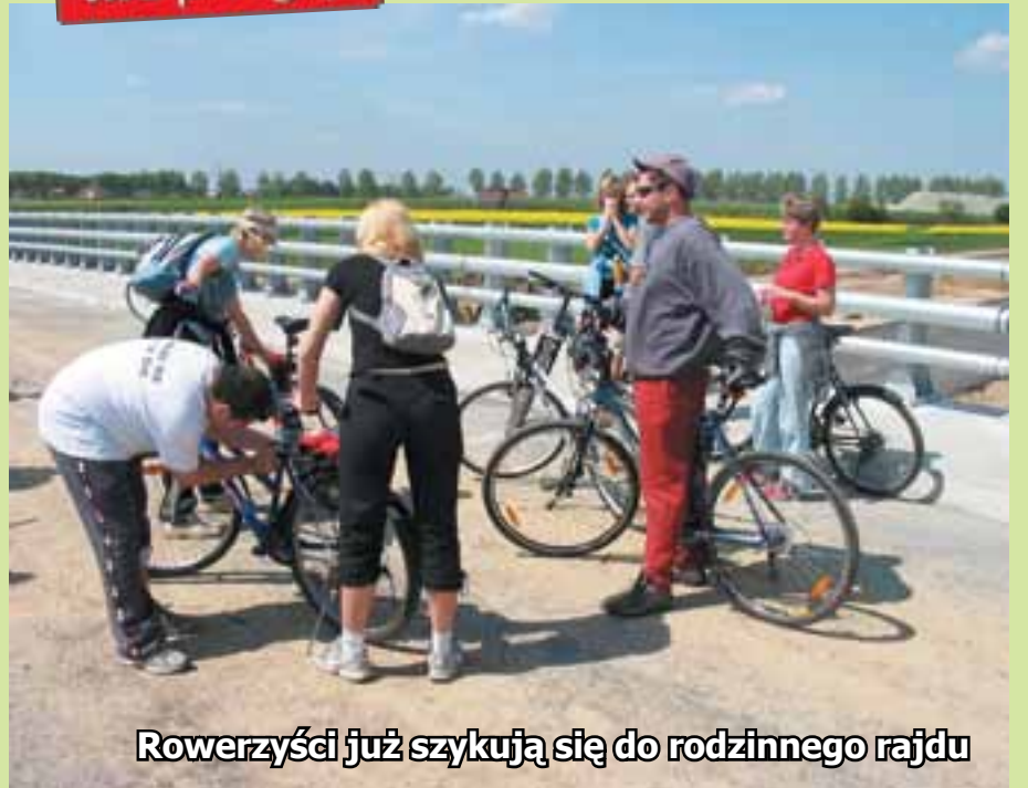
Rowerzyści już szykują się do rodzinnego rajdu