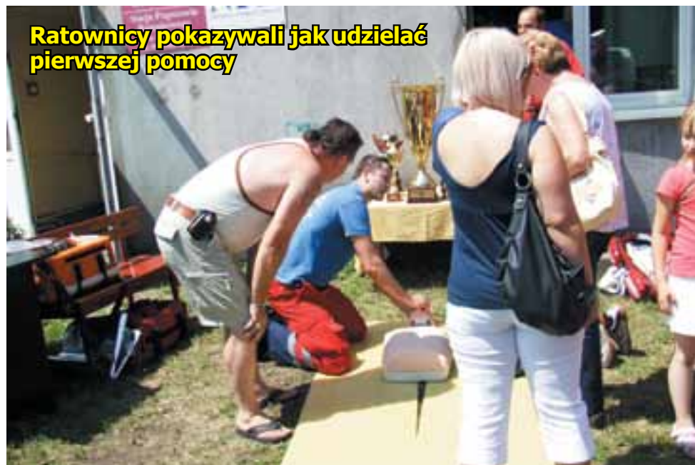
Ratownicy pokazywali jak udzielać pierwszej pomocy