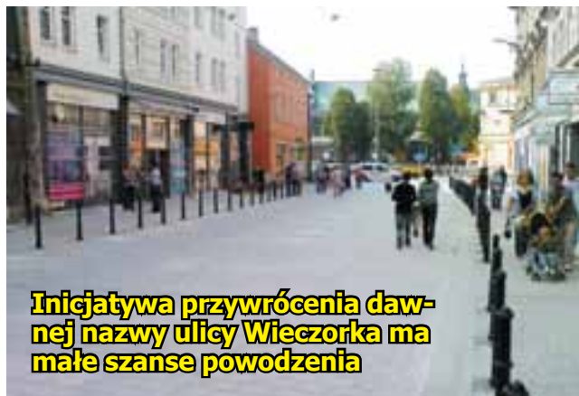
Inicjatywa przywrócenia dawnej nazwy ulicy Wieczorka ma małe szanse powodzenia

Czekamy na Państwa telefony pod numerem (32) 230-84-51, w piątek od 11.30 do 13.30. A o czym informowali nas Czytelnicy podczas ubiegłego dyżuru?