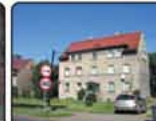
Gliwice droga wyjazdowa z miasta . Kamienica o powierzchni około 400 m 2 , 6 pustych mieszkań. II Działka 1300 m. Cena: 795.000 zł