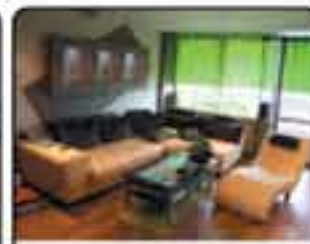
Gliwice osiedle Kopernika - mieszkanie o powierzchni 74 m 2 . Po remoncie kapitalnym, ciekawie zaaranżowane. Cena: 265.000 zł