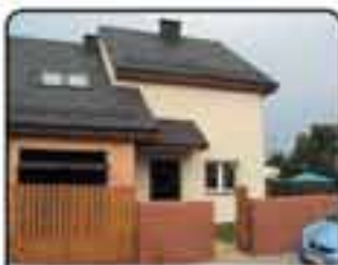
Gliwice Podlesie - bliźniak w stanie surowym zamkniętym. Pow domu 135 m 2 , pow działki 383 m 2 . Proponowana cena: 600.000 zł