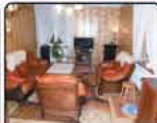
Zabrze ul. Knurowska , Mieszkanie 3-pokojowe o powierzchni 87 m 2 . II-gie piętro w niskim, zadbanym bloku. Proponowana cena: 197.000 zł