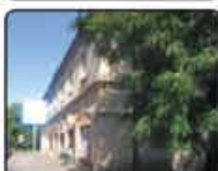
Gliwice Trynek - mieszkanie 2-pokojowe o powierzchni 36 m 2 . Niski blok, ocieplony. Mieszkanie do remontu. OKAZJA! Cena: 99.000 zł