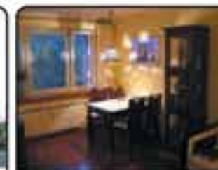
Gliwice Trynek - mieszkanie 3-pokojowe o powierzchni 70 m 2 . Wysoki standard, ciekawa aranżacja. Budynki z cegły. Cena: 290.000 zł