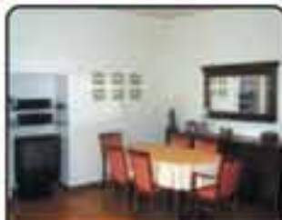
Gliwice okolice Jagiełłońskiej - komfortowe mieszkanie o powierzchni 98 m 2 . Bardzo dobry stan techniczny. Proponowana cena: 315.000 zł