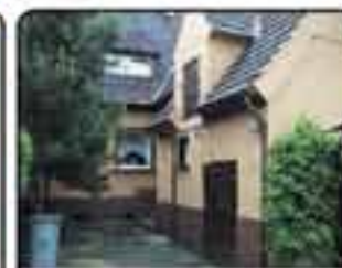
Zabrze Zaborze - dom w zabudowie bliźniaczej. Pow domu 125m 2 . Pow. Działki 230 m 2 . Proponowana cena: 370.000 zł