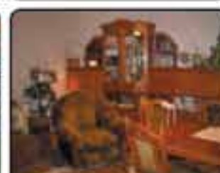
Gliwice os. Gwardii Ludowej - mieszkanie o powierzchni 83 m 2 . 9 piętro, 3 niezależne pokoje, dobry stan techniczny. Cena: 235.000 zł