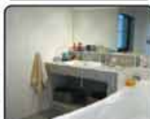
Zabrze okolice Stadionu , Dom wolnostojący o powierzchni 190 m 2 . Działka 451 m 2 . Rok budowy 1990. Proponowana cena: 670.000 zł