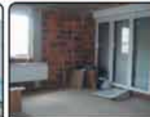
Knurów okol. Inermarche - nowy dom - skrajna szeregówka. Pow 193m działka 412m. Stan surowy zamknięty, wyłoki, instalacje. Cena: 440.000 zł