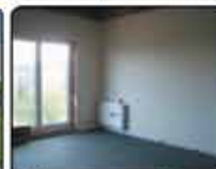
Gliwice - nowoczesne osiedle. Mieszkanie 1,2,3 i 4-pokojowe. Budynki 2-piętrowe z windą. INWESTYCJA ZAKOŃCZONA