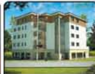
Zabrze Centrum - nowe mieszkanie 2,3,4 pokojowe w stanie deweloperskim. Odbiór kwiecień 2011. Cena około 4000 zł / m 2