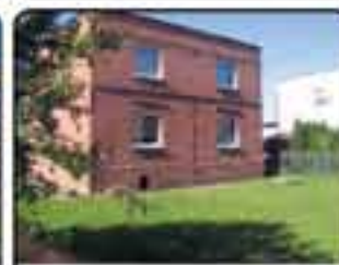
Paniówki - dom wolnostojący na działce 1050m. Pow domu 150m. Idealne do zamieszkania na 2-rodz lub na firmę. Cena: 419.000 zł