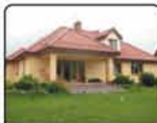
Gliwice - dom wolnostojący z 2005 roku o powierzchni około 240 m 2 . Działka 1100 m 2 . Świetna lokalizacja. Cena: 1.100.000 zł