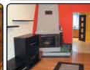
Zabrze okolice Stadionu Damrota . Kwaterka po remoncie kapitalnym. Powierzchnia 36 m 2 . Proponowana cena: 90.000 zł