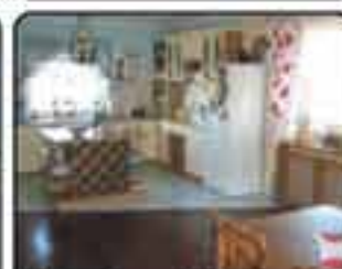
Okolice Tamowskich Gór - Dom wolno stojący z 2008 roku o powierzchni 240 m 2 . Działka 1250 m 2 . Cena: 565.000 zł