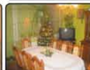
Gliwice Zubrzyckiego - mieszkanie 2-pokojowe o powierzchni 52m. Dobry stan techniczny, wyremontowany białe. Proponowana cena: 184.000 zł