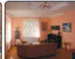
Gliwice okolice Sądu - piękne mieszkanie o powierzchni 112 m 2 . 4-pokoje po remoncie kapitalnym. Proponowana cena: 460.000 zł