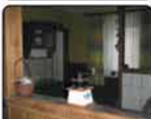
Zabrze Kończyce - dom w zabudowie bliźniaczej. Powierzchnia domu 100 m 2 , powierzchnia działki 638 m 2 . Cena: 350.000 zł