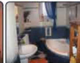
Gliwice Plac Piłsudskiego - mieszkanie 3-pokojowe o pow 85 m 2 . Parter. Bardzo dobry stan techniczny. Idealne na szatelnę. Cena: 325.000 zł