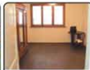
Zabrze Centrum Góra św. Anny . Mieszkanie 2-pokojowe o powierzchni 90,8 m 2 . Mieszkanie do remontu. Proponowana cena: 120.000 zł