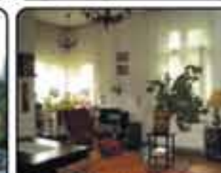
Zabrze Sienkiewicza Mieszkanie w kamienicy. Powierzchnia mieszkania 112 m 2 . 4-pokoje na I-szym piętrze. Proponowana cena: 285.000 zł