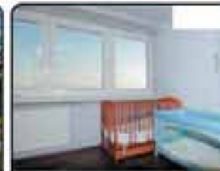
Gliwice Łużycka - mieszkanie 3-pokojowe o powierzchni 47 m 2 . Bardzo dobry stan techniczny. Idealne pod wynajem. Cena: 190.000 zł