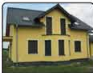
15 kilometrów od Gliwic . Dom wolnostojący w stanie deweloperskim o powierzchni 240m. Działka 801m. Cena: 565.000 zł