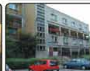
Zabrze ul.Nad Kanalem , Mieszkanie 2-pokojowe o powierzchni 78 m 2 . Bardzo dobra lokalizacja, niski blok. Proponowana cena: 230.000 zł