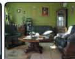
Stare Gliwice - okolice Kozieleckiej Komfortowy dom w zabudowie szeregowej. Powierzchnia domu ok 210m. Cena: 620.000 zł