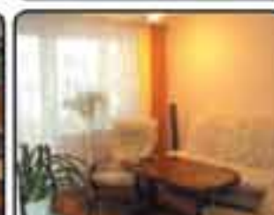
Zabrze Centrum os. Barbary . Mieszkanie 3-pokojowe po remoncie o powierzchni 52 m 2 . W cenie wyposażenie. Cena: 145.000 zł