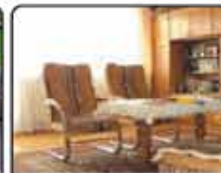
Zabrze Mikulczyce - dom wolno stojący o powierzchni 160 m 2 . Powierzchnia działki 681 m 2 . Dobra lokalizacja. Cena: 450.000 zł