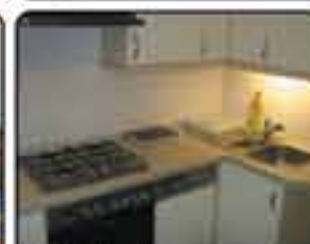
Gliwice Warszawska - mieszkanie 3-pokojowe o powierzchni 61 m 2 . Dobry stan techniczny, zadbane białe. Proponowana cena: 235.000 zł