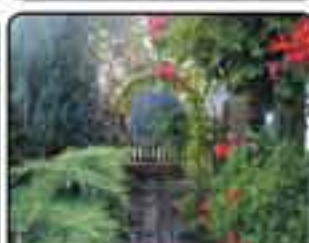
Gliwice Żemiki - dom wolnostojący o powierzchni około 240m. Działka 415m. Wysoki standard, gustowne wykończenie. Cena: 650.000 zł