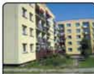
Zabrze Zaborze , Mieszkanie 2-pokojowe o powierzchni 52 m 2 . Wysoki parter. Dobry stan techniczny. Proponowana cena: 148.000 zł