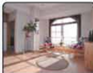
Gliwice Sikornik - dom w zabudowie szeregowej o powierzchni 360m. Bardzo wysoki standard. Cena: 980.000 zł