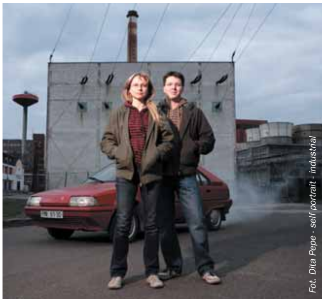
Fot. Dita Pepe - self portrait - industrial