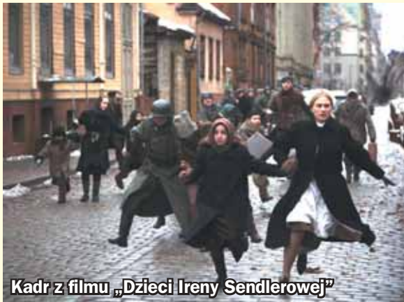
Kadr z filmu „Dzieci Ireny Sendlerowej”

To już drugie spotkanie z cyklu „Muzeum Muz”, będącego wspólnym projektem Muzeum w Gliwicach i Teatru Nowej Sztuki.